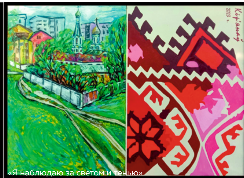
«Я наблюдаю за светом и тенью»

Особого внимания заслуживает работа: «Я наблюдаю за светом и тенью». В первую очередь она интересна своей идеей: связью реального мира с духовным, с традициями и наследием наших предков. На картине Нико-