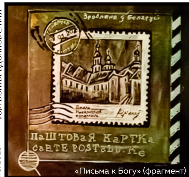
«Письма к Богу» (фрагмент)

Когда двое спорят, у каждого внутри бушует буря. Но взрослая буря проходит: выплеснулись, выдохнули, помирились. А ребёнок, который стал свидетелем ссоры, остаётся один на один с тревогой, которую не может ни проговорить, ни понять. Для него это сигнал: в мире что-то пошло не так. А если это происходит часто — то и мир в целом становится небезопасным. Отсюда тревожность, замкнутость, агрессия, нарушения сна, проблемы в учёбе. И, главное, искажённая модель отношений: «любовь — это когда кричат». А потом удивляемся, откуда у взрослых детей холод, обида, невозможность построить тёплую пару.