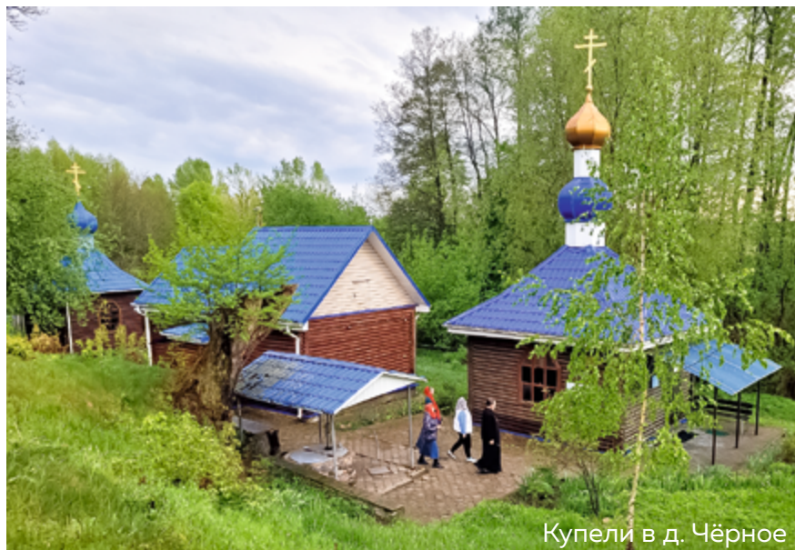
Купели в д. Чёрное

История церкви в Чёрном, как и большинства наших храмов, сложна и драматична. Известно, что был здесь некогда деревянный храм, сгоревший от удара молнии, был и каменный. В годы советской власти храм, как и другие, был разграблен, церковь превратили в зернохранилище. В 1936 году молния ударила в здание — всё сгорело дотла, включая зерно. Такого вразумления оказалось мало — и на том же месте построили амбар. История повторилась: снова молния, снова пожар. Стихия раз за разом сжигала то, что пытались строить на святом месте.