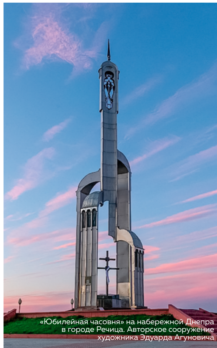
«Юбилейная часовня» на набережной Днепра в городе Речица. Авторское сооружение художника Эдуарда Агуновича