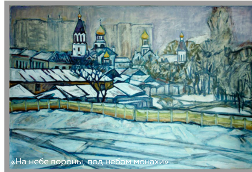
«На небе вороны, под небом монахи»

лаевская церковь соседствует с частью рушника, где земные дороги перетекают в орнаментальные узоры. Ткацкие узоры, украшающие рушники, — это не просто декоративный элемент, это сложный, закодированный рассказ о мироздании. Эти узоры — визуальное воплощение веры, отражение духовных традиций, бережно хранимых и передаваемых из поколения в поколение.